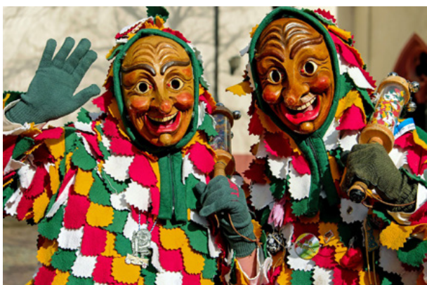
05. Karnawał szwabsko-alemański, Niemcy