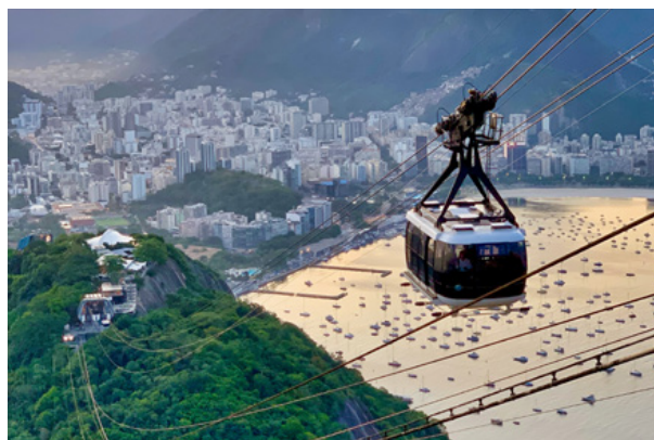
02. Rio de Janeiro, Brazylia, fot. Davi Costa, Unsplash