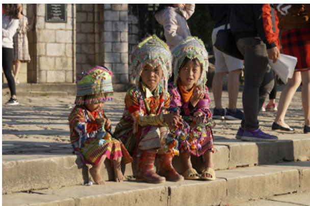
01. Dzieci w tradycyjnych strojach z górskich regionów Wietnamu