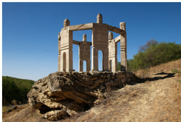
02. Posąg tańczących hore, Mołdawia