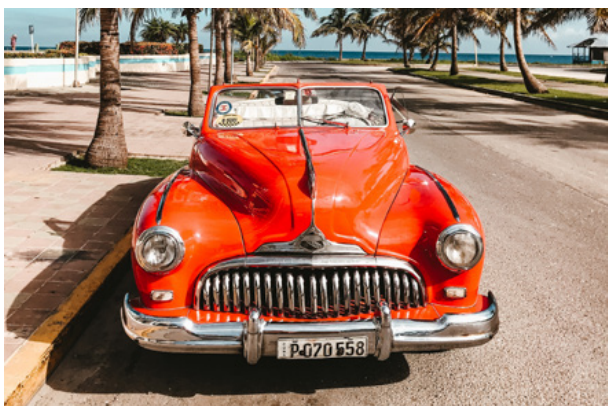
01. Charakterystyczny stary samochód, Hawana, Kuba