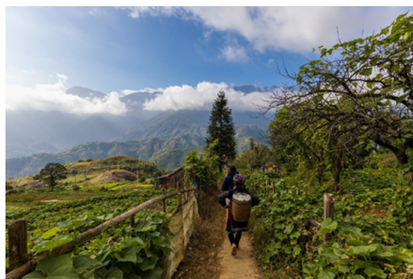
06. Rejon górskiego miasta Sapa w prowincji Lao Cai, Wietnam