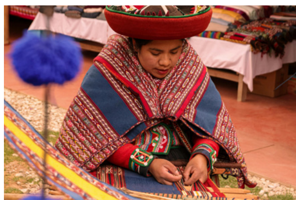
06. Kobieta w tradycyjnym stroju z okregu Chinchero, znanego z tradycyjnego tkactwa, prowincja Urubamba, region Cuzco, Peru, fot. Joel Alencar, Pexels