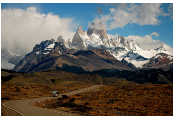
05. Patagonia