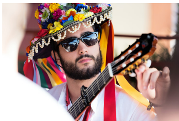
04. Muzyk strojący gitarę, Malaga, Hiszpania