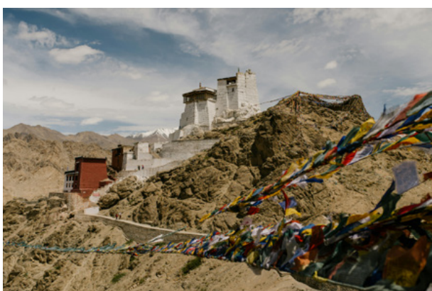
03. Pałac w mieście Leh w Himalajach Wysokich, Indie, fot. Julia Volk, Pexels