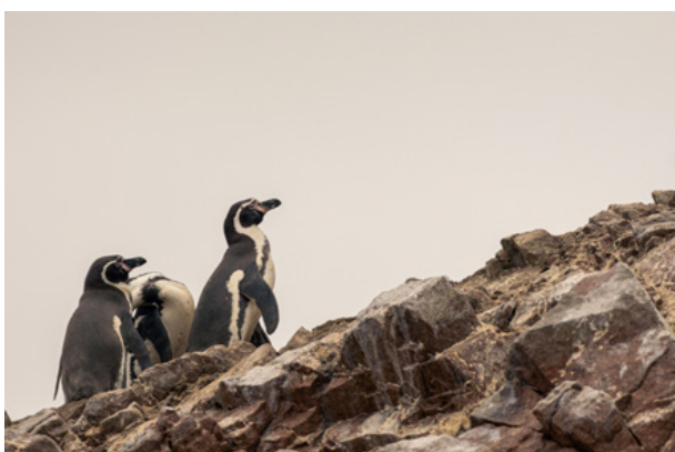
03. Pingwiny w Rezerwacie Narodowym Paracas, Peru, fot. Joel Alencar, Pexels